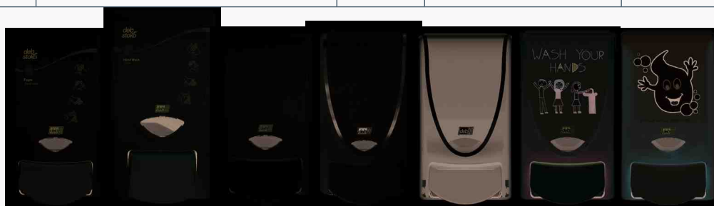
WRM1LDSSTH WRM2LDPSTH WHB1LDS CHR1LDS PR000BLKCR WYH1LDS MSS1LDS