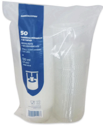
Imagen de paquete